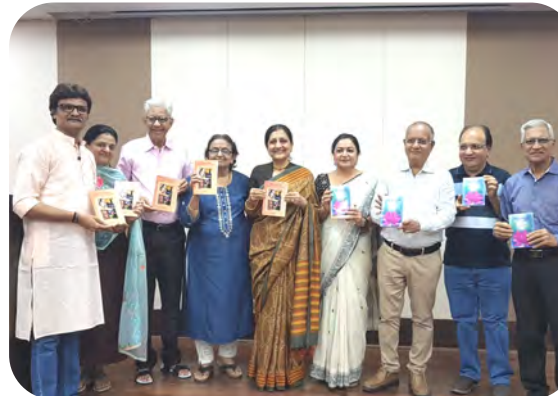
Dept. of Gujarati