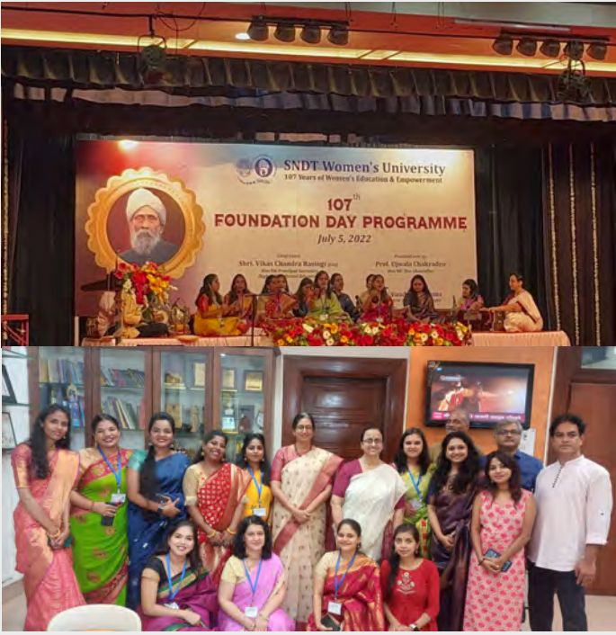
Dept. of Music Churchgate