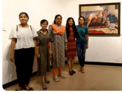
Dept. of Drawing & Painting