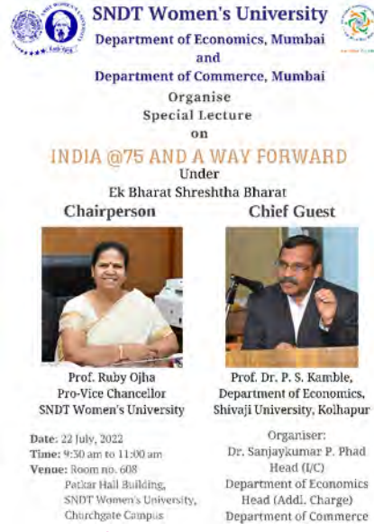
Dept. of Economics